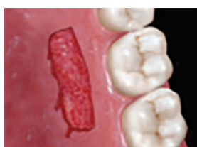
遊離歯肉移植術などでの口蓋側歯肉採取後の状態。