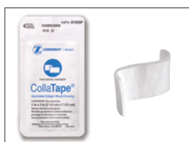
パッケージよりコラテープを取り出す。