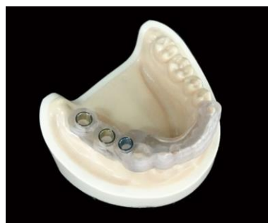
・サージカルガイド

国内において非常に高い水準のインプラント手術支援システムを提供する、株式会社アイキャットとの提携により、BIOMET 3i Navigator® System 対応のインプラントシミュレーションデータ/サージカルガイドを提供することが可能となりました。これにより、CT 画像からシミュレーションソフトで立案された治療計画を基に、高精度なインプラントシミュレーションデータ/サージカルガイドを提供し、インプラント埋入精度を向上することができます。特に解剖学的に注意が求められる部位や残存歯根近接部位など、インプラント埋入範囲に制限を受ける症例においても、適切な位置にインプラント体をより安全に埋入することができます。弊社はインプラント手術支援システムメーカーとの提携により、ますます多様化するお客様のニーズにお応えしていく所存です。